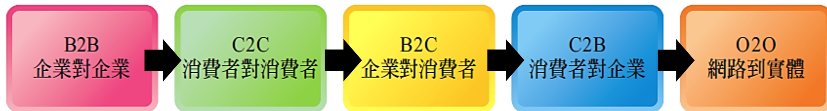
內地五大主要電子商貿活動類別

於電子商貿的領域中，消費者、商家及其他團體（如政府）之間的互動/ 活動有很多種。中國電子商務研究中心指出，內地電子商貿的活動中，主要包括B2B（企業對企業）、C2C（消費者對消費者）、B2C（企業對消費者）、C2B（消費者對企業），以及O2O（Online to Offline；網路到實體）五大類。